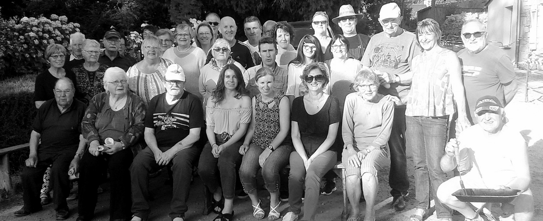
Samedi 23 juin, environ trente habitants, amis du Vieux Bourg et Madame Le Maire, se sont retrouvés à l'occasion de leur traditionnel repas de quartier, autour du feu de la Saint-Jean.

tretien régulier afin de le maintenir en bon état de fonctionnement et de lui permettre d'assurer sa fonction de libre écoulement des eaux provenant de l'amont de sa propriété.