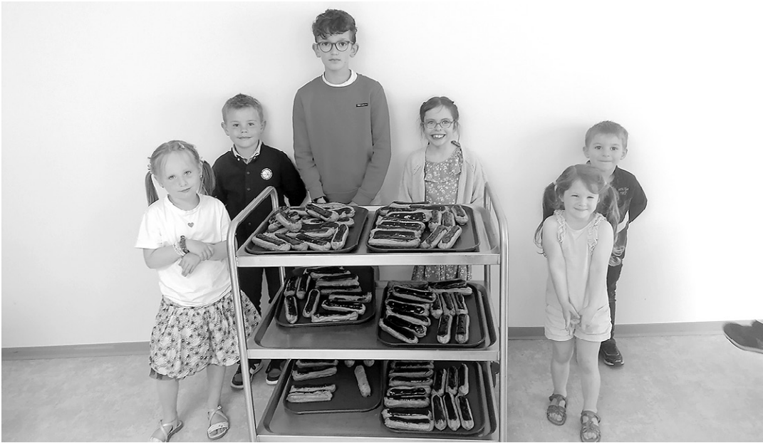
Les anniversaires du mois de mai 2022 ont été fêtés au restaurant scolaire.