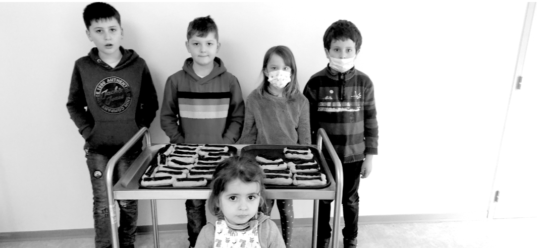
Les anniversaires du mois de février 2022 ont été fêtés au restaurant scolaire.

distribué aux familles par mail à partir du vendredi 11 mars. Le programme sera disponible sur le site de la Commune : http://www.saint-barthelemy56.net/ rubrique : « En un clic / Téléchargements » Les familles peuvent contacter la mairie au 02/97/27/10/88 ou à l'adresse mail suivante : contact@saint-barthelemy56.fr Nous rappelons aux familles aussi qu'il est possible d'inscrire leurs enfants à l'Accueil de loisirs les mercredis pendant la période scolaire.