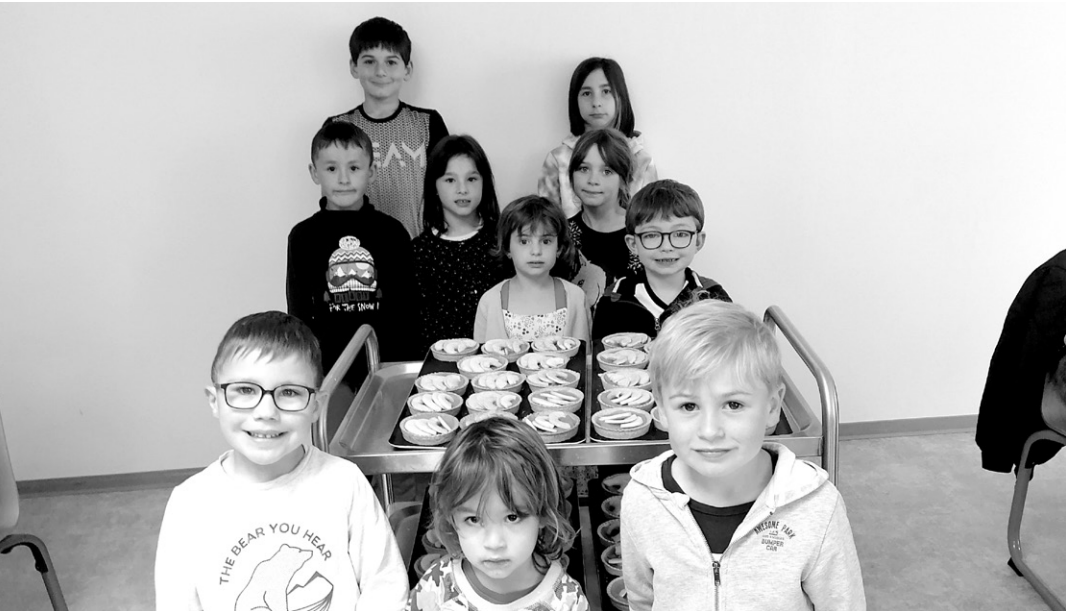
Les anniversaires du mois de mars et d'avril 2022 ont été fêtés au restaurant scolaire.

Inscription au transport scolaire - rentrée 2022/2023 Pour les élèves des écoles primaires et maternelles de : Baud / Guénin / la Chapelle-Neuve / Melrand / Pluméliau-Bieuzy / St-Barthélemy. Date limite de retour du dossier le 15 juin 2022