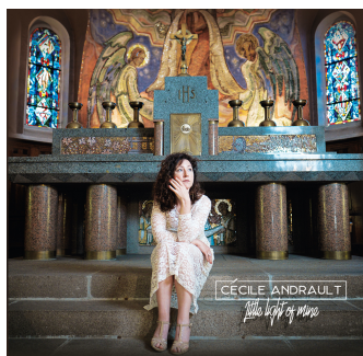
Les amis du Manéguen