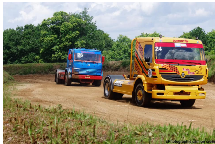
camion cross