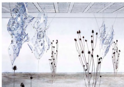
l'art dans les chapelles

Infos 02 97 27 97 31 ; ; www.artchapelles.com