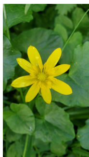
Valika Le Boutouiller

Infos 06 10 62 62 96 ; centrebretagne.nature@gmail.com ;