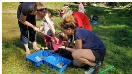
La Balade du Père Nicolas