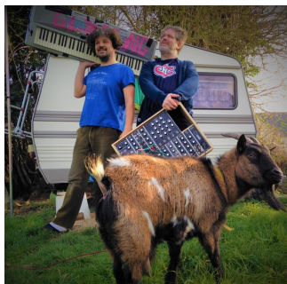
Gil Jogging & Ton's