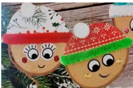
La Maison des Fleurs Baud

Infos 02 97 51 17 51 lamaisondesfleurs.baud@gmail.com ;